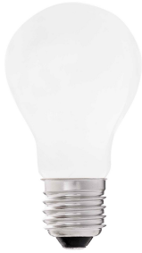
Ampoule A60 MAT LED E27 8W 2700K 640Lm