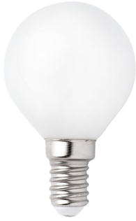
Ampoule G45 MAT LED E14 4W 2700K 450LM