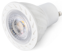
Ampoule GU10 LED 7,5W 2700K 60°