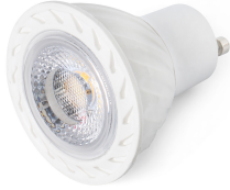
Ampoule GU10 LED 7W 2700K 38°