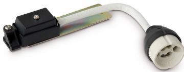
Lampe pour encastré GU10